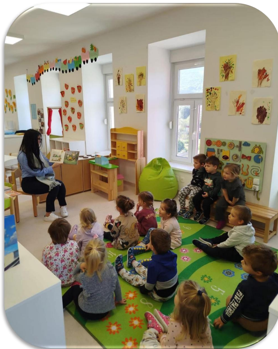
KNJIŽNIČARKA U SKLOPU MJESECA HRVATSKE KNJIGE ODRŽALA PRIČAONICU U DJEČJEM VRTIĆU BODULIĆ

Knjižnica ima odličnu suradnju s Dječjim vrtićem Bodulić . Cilj posjeta vrtićima je približiti djeci svijet knjige, važnost čitanja od najranije dobi te uloga knjižnice u društvu.