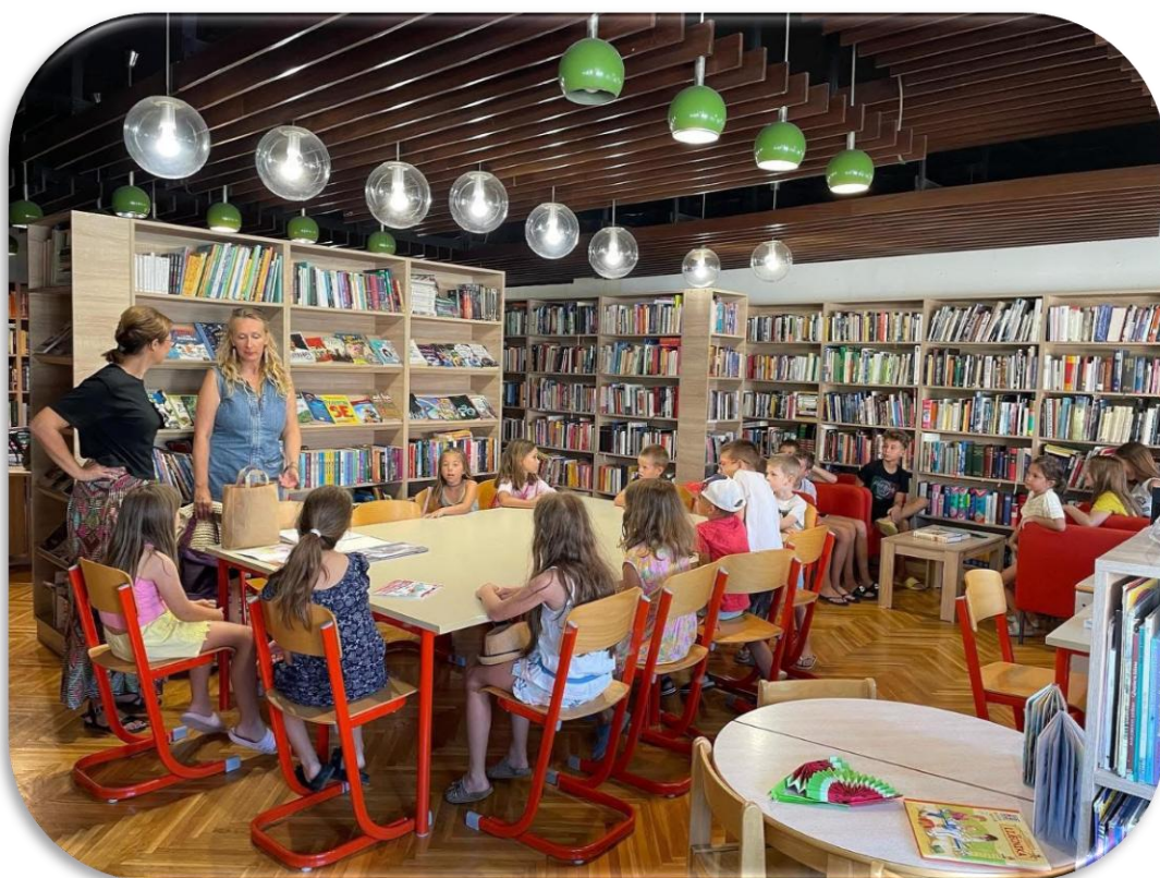
LJETO U KNJIŽNICI / KNJIŽEVNI SUSRETI