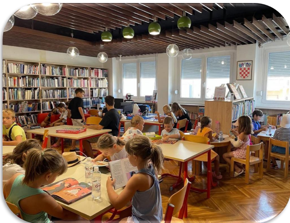
LJETO U KNJIŽNICI / DRUŠTVENE IGRE