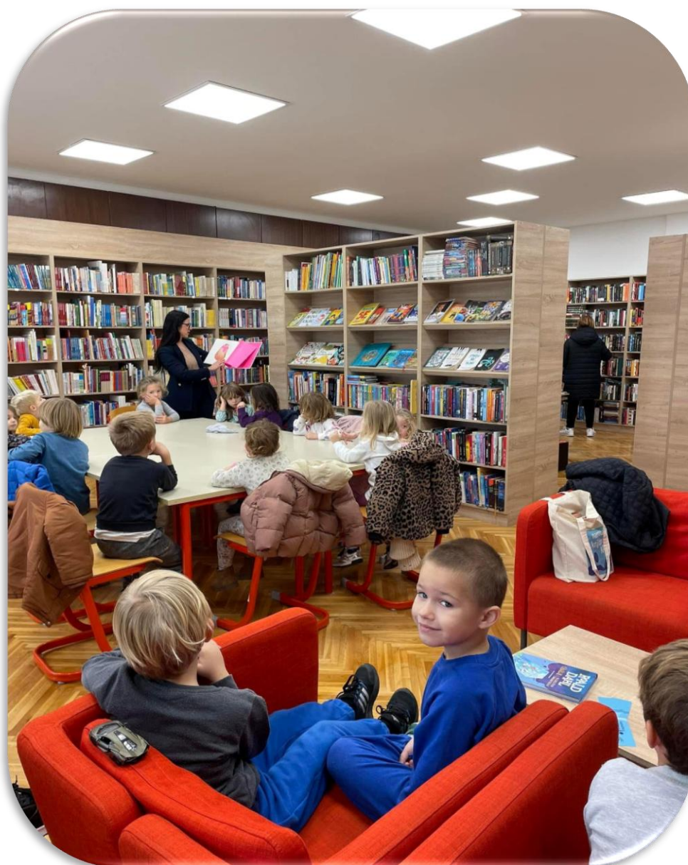
DJEČJI VRTIĆ SRDELICA U POSJETU NARODNOJ KNJIŽNICI KALI

Važna uloga knjižnice je odgoj i obrazovanje, upravo zato je važna suradnja Narodne knjižnice Kali i Dječjeg vrtića Srdelica . Suradnja s vrtićima za knjižnicu znači i lakše pronalaženje novih „malih“ korisnika. Knjižnica omogućava odgojiteljima posudbu knjižnične građe za svoju vrtićku skupinu. Predškolicima knjižnica daruje besplatno članstvo u sklopu programa Mjesec hrvatske knjige.