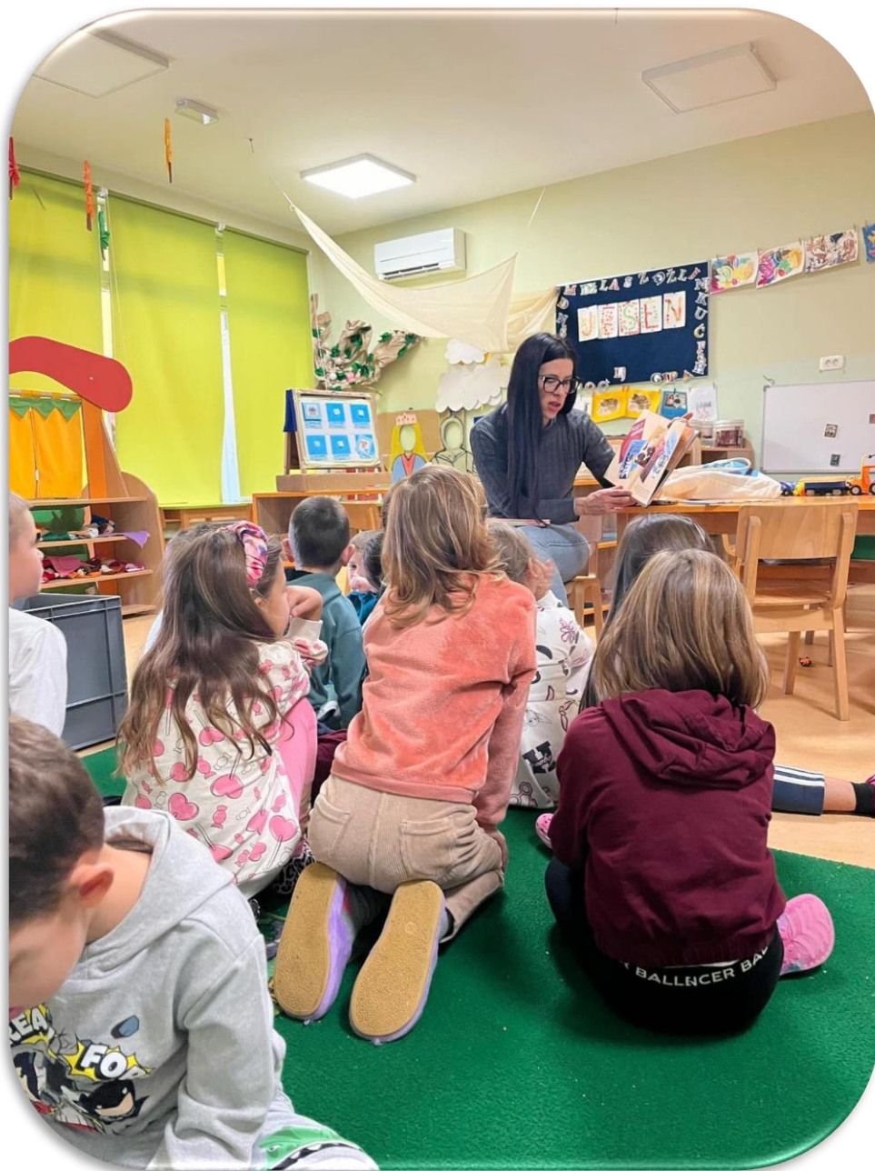
KNJIŽNIČARKA U SKLOPU MJESECA HRVATSKE KNJIGE ODRŽALA PRIČAONICU U DJEČJEM VRTIĆU LASTAVICA

U 2024. godini Knjižnica je počela suradnji i s Dječjim vrtićem Lastavica . U posjetu knjižničarka im je pročitala slikovnice iz serijala „Mali ljudi, veliki snovi“. Priče su to o životima istaknutih ljudi sportaša , glazbenika, dizajnera.. koji su ostvarili velika postignuća, ali je svatko od njih na početku bio samo dijete s velikim snom.